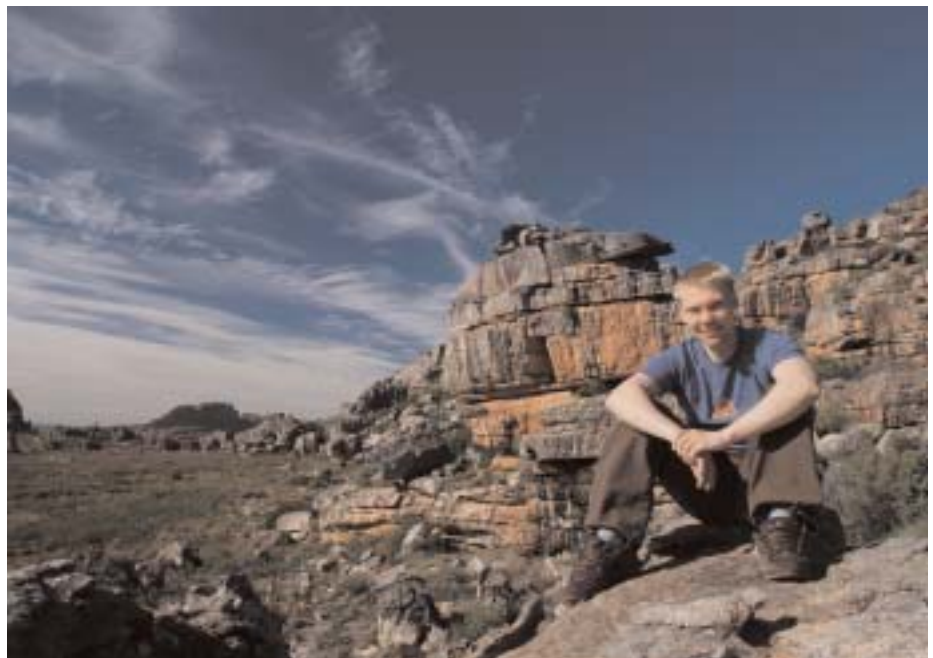
Rocklands med Road Side i bakgrunnen