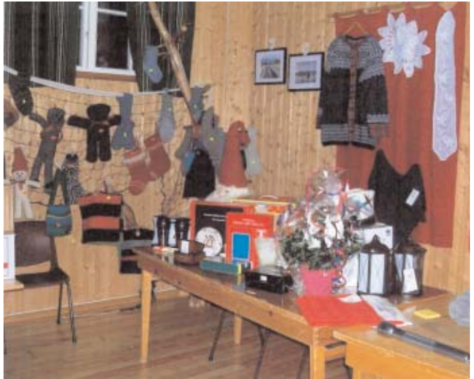
Mangfold og mengder - Julebasaren på Vidrek har blitt en tradisjon som trekker folk langveisfra!

tider nokka vill i blikket og varm i trøya, men kaffe og munnfyll blei det på de som ønska det, og alle var gangfør når dagen var omme. Det er vel fantastisk at vår lille bygd med noen ildsjeler klarer å engassjere så mange til å møte frem på vært arrangement når det - som denne dagen - var 4 julemesser rundt om i nærområdet. Om vi kanskje mange ganger synes det er mye arbeid, - vi glemmer slitet når resultatet blir bra og vi har vært med å bidratt til å klare kravene som følger med å drifte grendehuset. Det gjenstår vel bare å takke alle de som gjorde det mulig å få til en slik messedag og få et så godt resultat.