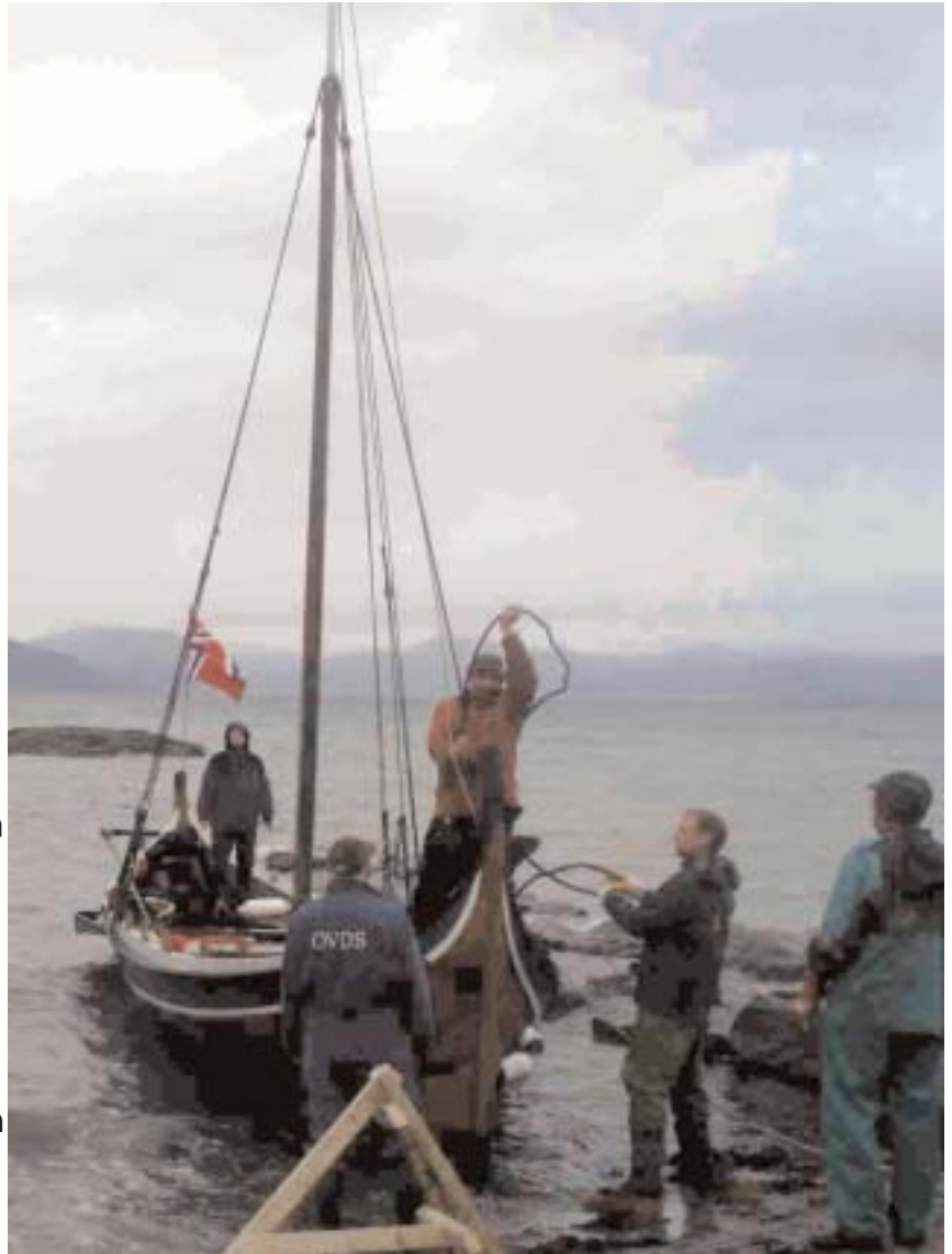
En storåttring er et majestetisk skue, og er ikke mye mindre enn fambøringen. Skinnyfken er 6 fot mindre enn Hildringstimen. Her rigges den ned før oppsetting i kongsbakknaustet